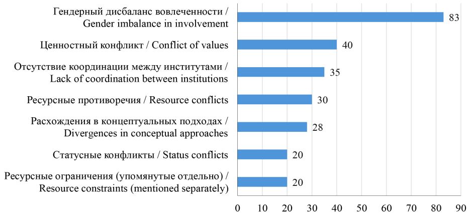
Р и с. 1. Структура латентных конфликтов в институциональном взаимодействии при духовно-нравственном воспитании, %